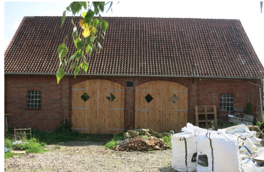
Verbunddorferneuerung Weserdörfer Arbeitskreissitzung 28.09.2021